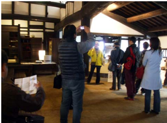
山口家住宅 主屋の土間